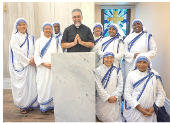
▲德蘭園賜和平神父與仁愛傳教修女會台南及台北會院的修女們在聖體小堂的「我渴」彩繪玻璃前合影留念。