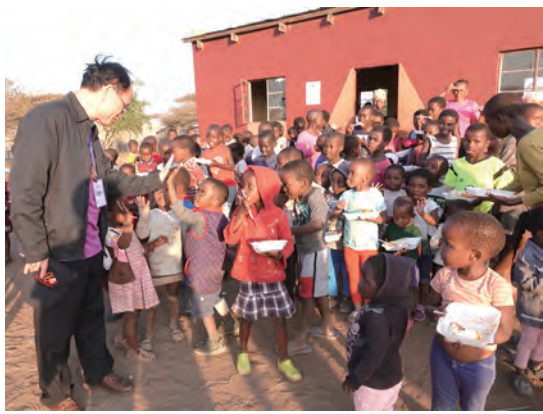
▲吃一盤白米飯是多麼開心的事