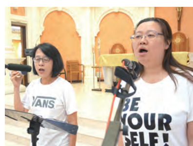
▲板橋懷仁堂青年樂團潛力無窮，融合器樂與人聲之美，唱出蓬勃朝氣。

來救助我……我們時時仰望、信賴上主……」他們以原鄉住民特有的嗓音，不加修飾，樸實、純真地讚揚天主！