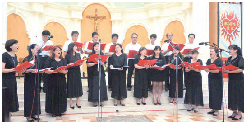
▲蘆洲大聖若瑟玫瑰聖詠團以無伴奏詠唱〈羔羊讚〉，相當動聽。