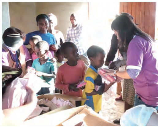
▲送上物資也送上我們的關懷心意