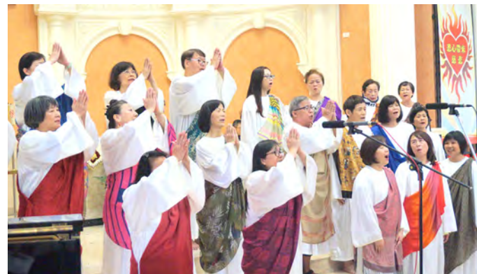
▲大坪林聖三堂聖詠團唱作俱佳，贏得合唱組冠軍實至名歸。