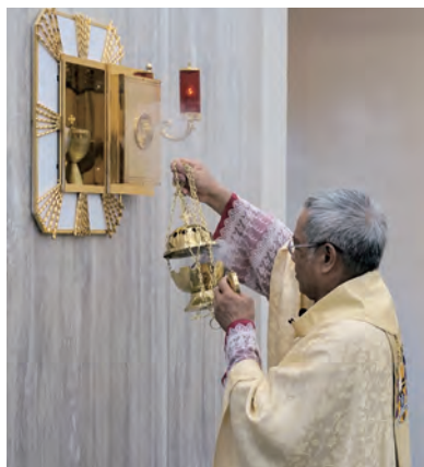
▲洪山川總主教在感恩聖祭中祝聖並同時啟用聖體小堂。