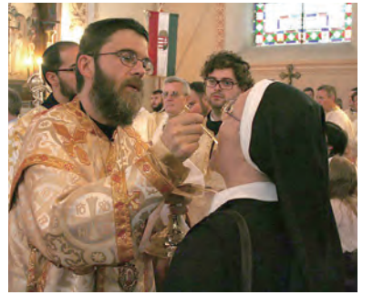
▶以聖匙口領聖餐 (取自Holy Dormition Byzantine Catholic Church) ◀最後晚餐的聖像畫 (取自修道院東方禮聖堂壁畫)

主祭神父在領受完聖餐後，恭敬地將印有NIKA的兩塊聖體分成小塊，放入聖爵內，與此同時，執事端上熱水，主祭神父祝福後，執事將適量的熱水以十字形注入聖爵，口念「熱誠的信德，充滿聖神」；在領受聖餐前將「熱開水」(le zéon，出自希臘文ζέον) 注入聖血中是拜占庭禮特有的形式。而酒水的攪合在拉丁禮彌撒中則象徵著天主取了我們的人性，我們也