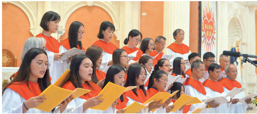
▲鶯歌天主堂聖詠團演出布農林班調譜曲的〈祈禱〉，真樸動聽。