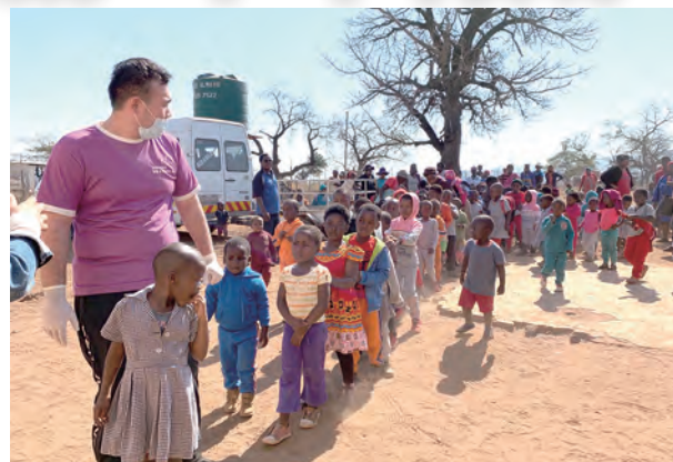
▲晴空下孩子們排好隊等著看醫生

NCP鄰里關懷站是教區明愛會為照顧孤兒所成立的關懷站，約有60個據點，教育並確保孩子們1天至少有1餐，台中教區在善心人士慷慨解囊下，每年認捐10個關懷站的兒童餐食費，並前往4個據點，為他們進行醫療義診及發放物資。醫療團除了團長趙榮勤醫師及連續來了4、5年的鐘朝海醫師、陳建利醫師、陳力平醫