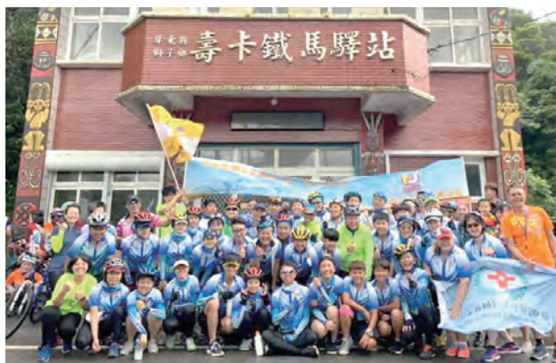
▲輔大車隊完成高難度的壽卡後合影。