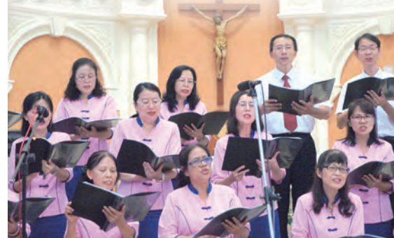
▲地主隊樹林耶穌聖心堂唱功一流，熱情服務更感人。