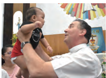
▲高舉幼兒，慈愛之情溢於言表。 ▲協進慈幼會士們歡迎總會長蒞臨