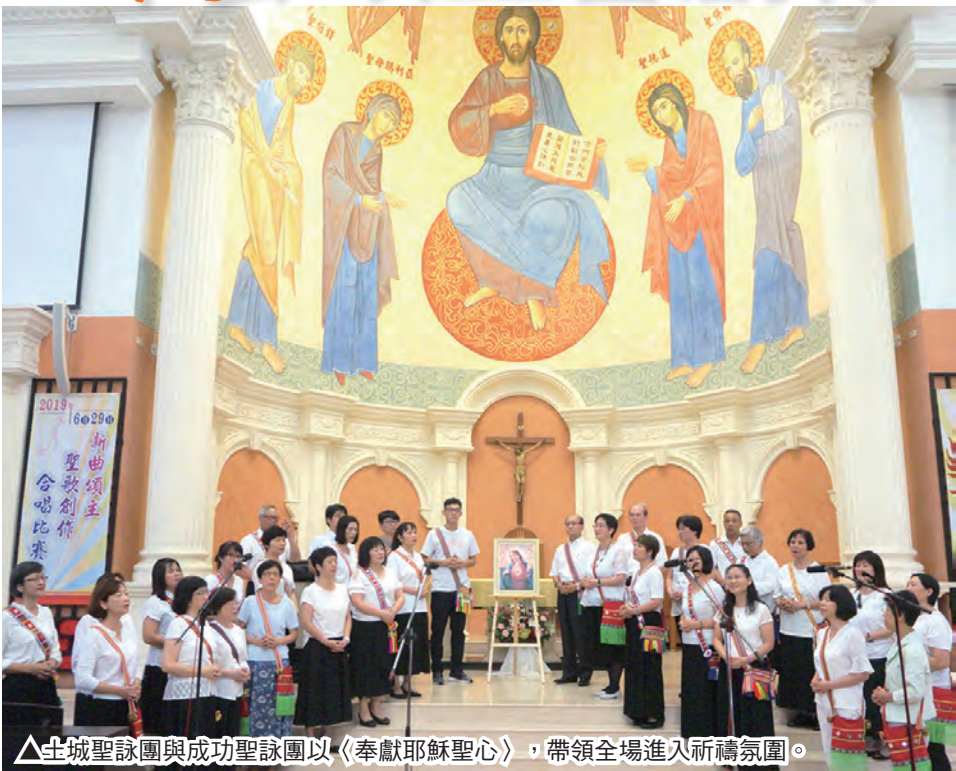
▲生城聖詠團與成功聖詠團以〈奉獻耶穌聖心〉，帶領全場進入祈禱氛圍。