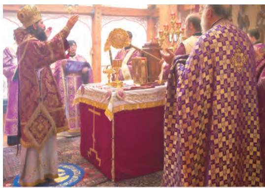
▲在盛有聖體聖血的聖爵上揮動著的聖扇

最重要的是，我們用勞苦的果實——麵包與酒獻給天主，獻禮在祝聖後成了耶穌基督的血肉，不可見的天主透過基督的聖體聖血成了我們的日用食糧，好餵養我們的生命，使我們真正地成為基督內的肢體，與祂合而為一。整個救贖奧蹟都在禮儀過程中真實地臨現出來，不只为「紀念」(anamnesis，出自古希臘文ἀνάμνησις，唸anámnesis) 這項聖事，更為讓所有的參禮者能從中經驗天主奧蹟的生命力。 (待續)