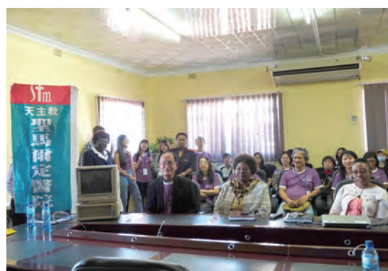
▲聖馬爾定醫院捐贈醫療器材充實善牧醫院設備 ▲寫著團員名字的牆面有著美麗的故事