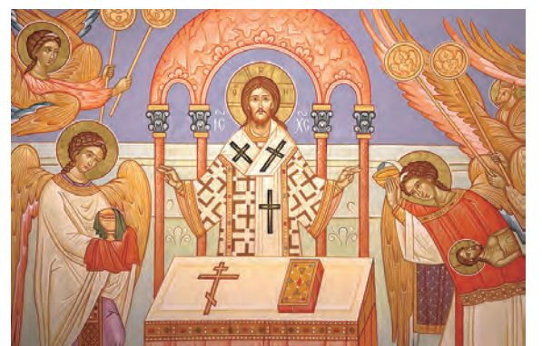
▲天使萬軍借眾參與這項感恩聖宴