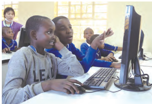
▲電腦種子學生初階學習操作電腦 ◀滿懷期待候診的居民們