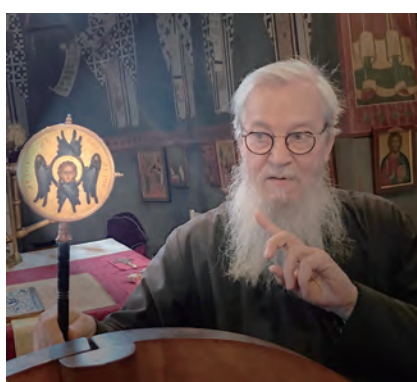
▲聖扇上繪有九品天使色辣芬的聖像畫