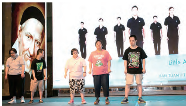
▲聖安娜之家的小天使在餐會中為最敬愛的院長爺爺獻舞

文神父當年成為修士、發願、晉鐸一直到來台，那份傳教熱火迄今從未熄滅，若非體力老化的自然限制，文神父還想繼續堅守崗位帶領羊群，直到最後。也讓我們注意到本土聖召的缺乏，國外傳教神父的凋零，我們仍需要年輕