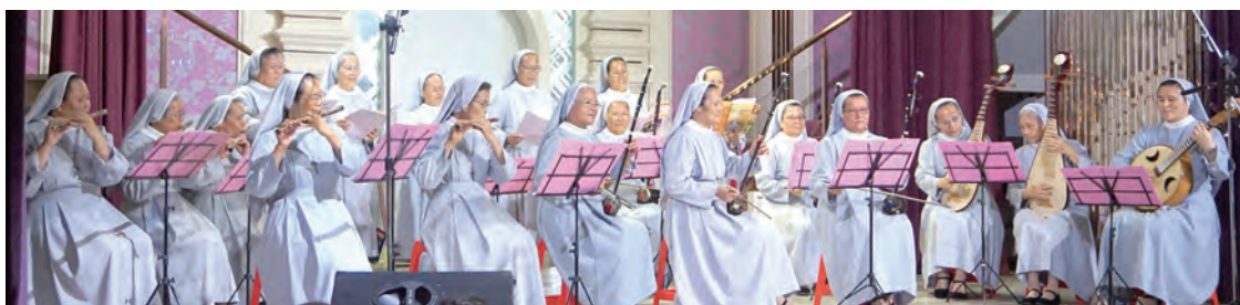
▲聖瑪爾大女修會的修女們在共融餐會中的國樂演出，帶來天使的祝福。

14年多的無悔全力拚搏，只為明亮的天主聖殿，不但全台教友佩服，連教外友人也加入奉獻行列。沙止堂的堅忍見證了天父的話語：「含淚播種的，必含笑收割。」（詠126：5）