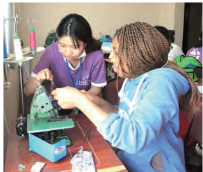
▲團員教導當地婦女使用縫紉機