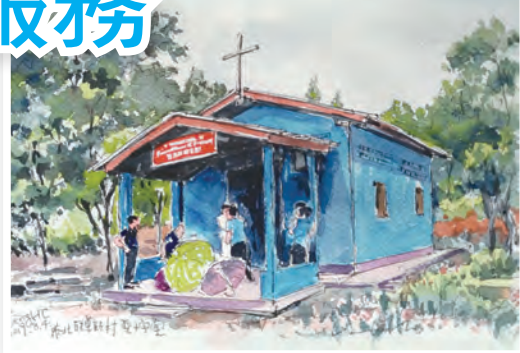
▲聯華村聖十字堂水彩寫生