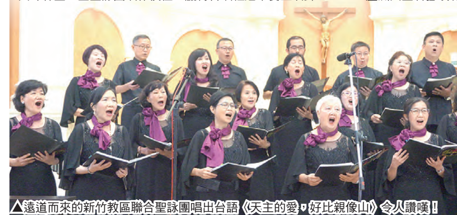
▲遠道而來的新竹教區聯合聖詠團唱出台語〈天主的愛，好比親像山〉令人讚嘆！

台灣音樂界近幾年興起了「宗教音樂風」，深耕音樂教育的領頭羊——杜黑老師領軍的台北愛樂文教基金會歷年來邀請世界各國優秀團體演出，豐富了國人的音樂素養；推出的曲目，每每都有「彌撒曲」等宗教音樂；2019年暑假推出連續5天的觀摩演出——海頓的〈創世紀〉；8月4日閉幕為莫札特的〈C小調彌撒曲〉，台北愛樂的盛美演出讓人感動，他們在無形中為做了不同形式的「音樂福傳」！