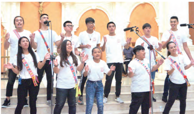
▲原住民天生好歌喉，運用全身、全心、全靈來美聲讚主榮。