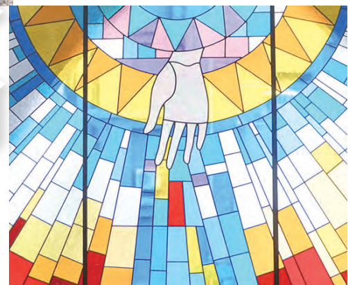
◀聖方濟聖髑▲聖堂內有8面巨幅彩玻，每幅都深具神學意涵。

沒無聞的「方濟」無私願捨，才得建立，相信耶穌正是這建築的角石，靠著祂，人們一同被建築。