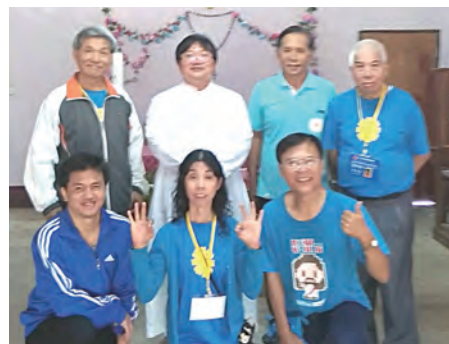
▲與包神父在聯華村聖十字堂