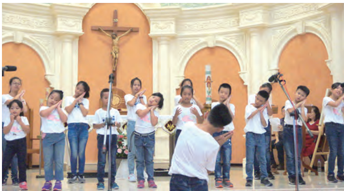
▲兒童青少年的天真純淨演出，感受祈禱的美好氛圍。