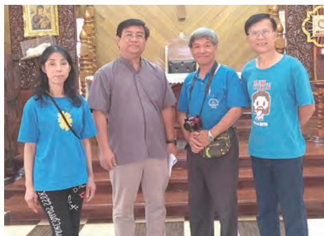
▲在清萊教區主教座堂與神父合影