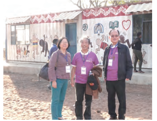
▲難民營中，志工團巧手改造貨櫃成為電腦教室