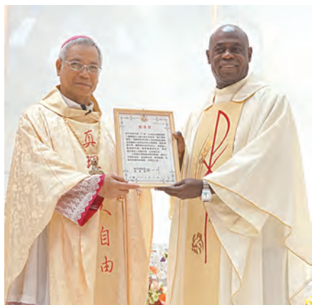
▲洪山川總主教頒發台灣教會批准書，昭告聖方濟朝聖地正式啟用。