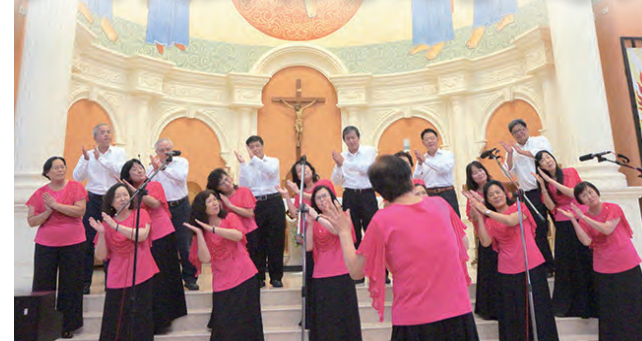
▲聖愛樂聖詠團挑戰另一種風味的《聖詠》150篇。