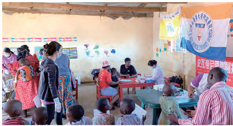
▲醫師們詳細的說明寬慰母親擔憂的心情