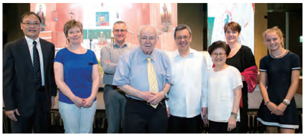
▲陳建仁副總統伉儷（右二、三），歡送可敬的文雅德神父（左四），並與文神父家人合影。