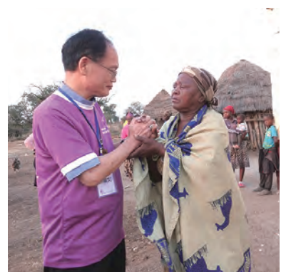
▲蘇耀文主教為失去兒子的姥姥祈禱